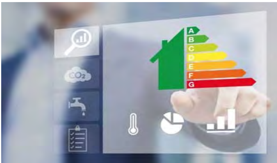
Energi- och driftoptimering – lägre kostnader