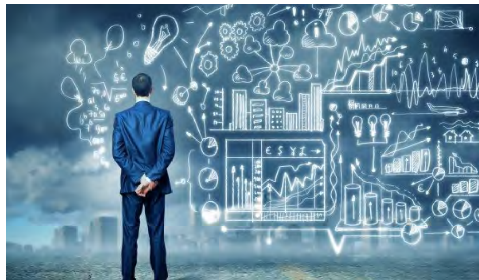
Plattform för innovation – hantera utvecklingskrav