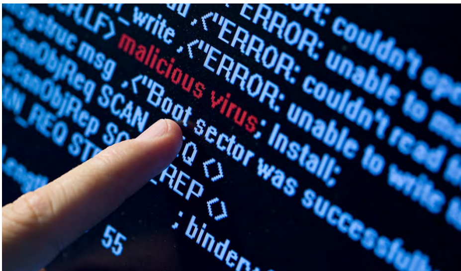
IT-säkerhet – minskad risk