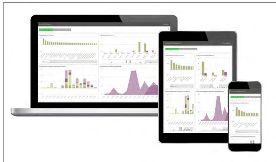
Nya affärer – högre intäkter